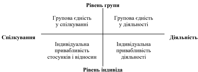
Рис. 1. Чотирифакторна модель згуртованості (А. Керрон, В. Відмеєр, Л. Бреулі)

Зупинімося відтак на вузькому тлумаченні згуртованості. Візьмімо для прикладу багатовимірну модель згуртованості спортивної команди, яку запропонували А. Керрон, В. Відмеєр і Л. Бреулі в середині 1980-х років. Ця модель викликала підвищений інтерес і стала основою для перевірки її застосовності щодо інших типів груп (Carron, Widmeyer, & Brawley, 1985). Автори моделі визначають згуртованість як “динамічний процес, що відображається в тенденції групи триматися разом і залишатися єдиною в досяганні її інструментальних цілей і задоволенні афективних потреб її членів” (Carron, & Brawley, 2000). Дослідники виокремлюють два виміри згуртованості: індивідуальний рівень і рівень групової інтеграції (рис. 1). Індивідуальний рівень представлений двома аспектами: емоційним і когнітивно-діяльним. Перший аспект відображає задоволеність індивіда спілкуванням з членами групи, їхню привабливість та персональні відносини. Другий аспект – про задоволеність тим, як команда діє, її результативністю та вигодою, яку отримує індивід від участі в спільних діях.