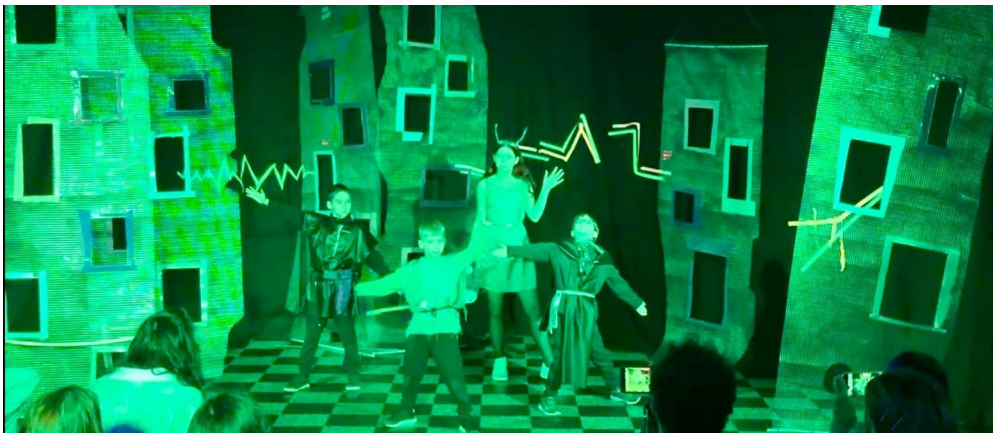
Рис. 3. Фрагмент постановки групи 3. Симетрична композиція і синхронізовані пози персонажів формують образ колективної дії, де проявляється узгоджена взаємодія, а не індивідуальне домінування.

самостійності й обмежена суб'єктність творця внаслідок втрати ним повного контролю. Це визначає суб'єктність як рефлексивно-динамічну, де суб'єкт не лише діє, а й усвідомлює межі власного впливу, тобто «я можу творити, але не все контролюю».