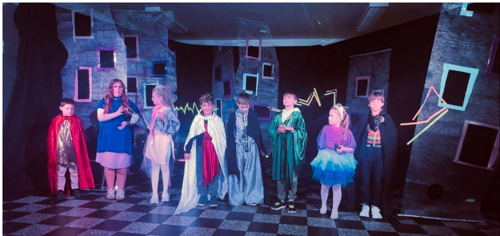
Рис. 1. Фрагмент постановки групи 1. Колективна сценічна композиція з рівномірним розташуванням персонажів без вираженого центру збігається з амбівалентним сприйняттям майбутнього в сценарії як відкритого, але структурно невизначеного простору взаємодії.

проявляється через участь у подіях, взаємодію з іншими та адаптацію до змін. Домінує реактивно-адаптивний тип суб'єктності, де поведінка визначається ситуацією, а не довгостроковими цілями (суб'єктність у стилі «я в потоці, але не керую ним»).