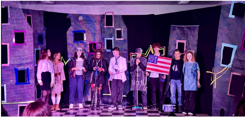
Рис. 4. Фрагмент постановки групи 4. Фронтальна композиція з чітко окресленими ролями і символічними атрибутами відображає структуроване бачення майбутнього як простору соціальних позицій, ідентичностей і владних взаємодій.

може змінити саму систему. Водночас поява мотивів трансформації і примирення свідчить про потенціал переходу від боротьби до більш складних форм взаємодії. Тобто агентність цієї групи можна визначити як «я борюся і впливаю, але в межах системи».