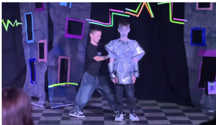
Рис. 2. Фрагмент постановки групи 2. Контраст між статичною центральною фігурою (кіборг) і динамічним рухом героя відображає напруження між контролем і дією

Аналіз сценарію групи 3. Сценарій групи 3 (11 учасників віком 8-13 років, з переважанням хлопців) відрізняється більш складною, багаторівневою структурою та наявністю рефлексивного виміру. Центральною ідеєю є створення світу або персонажів усередині самого сюжету, що формує ефект «сценарію в сценарії» (рис. 3).